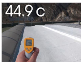
CON RIVESTIMENTO NEW FAST WHITE